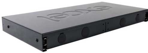
Rückseite des Panels