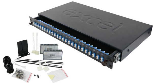
Schiebepanel inklusive Zubehör-Kit