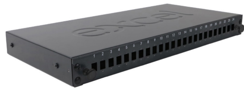
Ungeladene Vorderseite des Panels